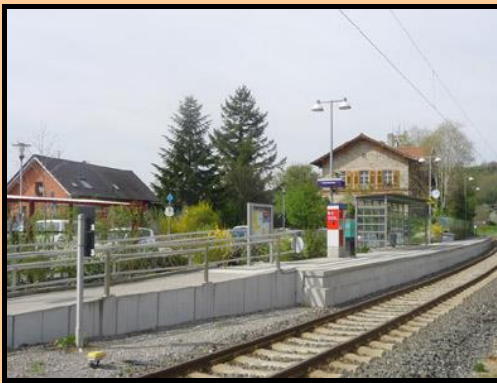
S-Bahnhof in Neidenstein