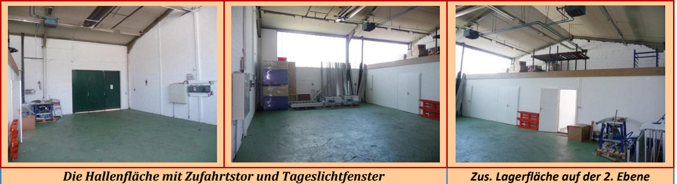
Die Hallenfläche mit Zufahrtstor und Tageslichtfenster